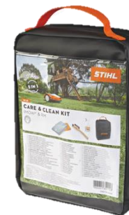
Care & clean kit iMOW+