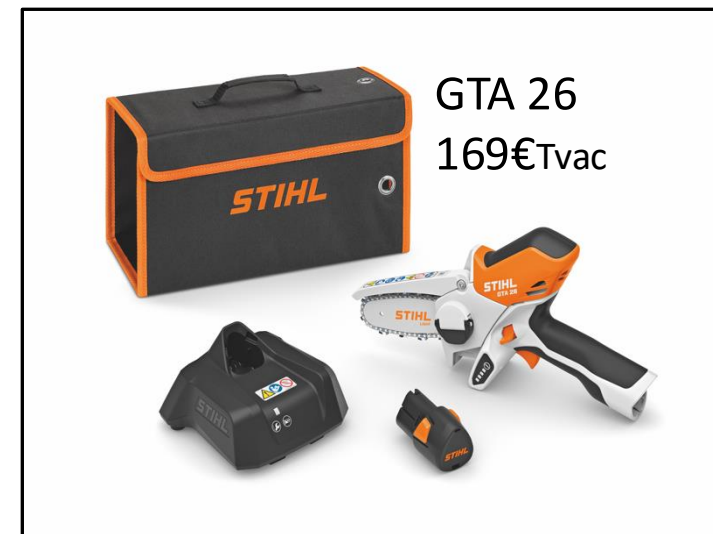
GTA 26 169€Tvac