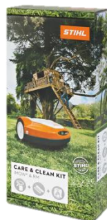
Care & clean kit iMOW