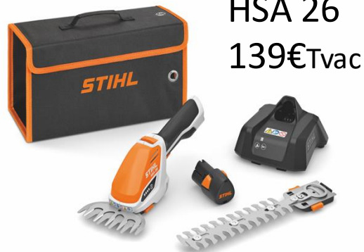
HSA 26 139€Tvac